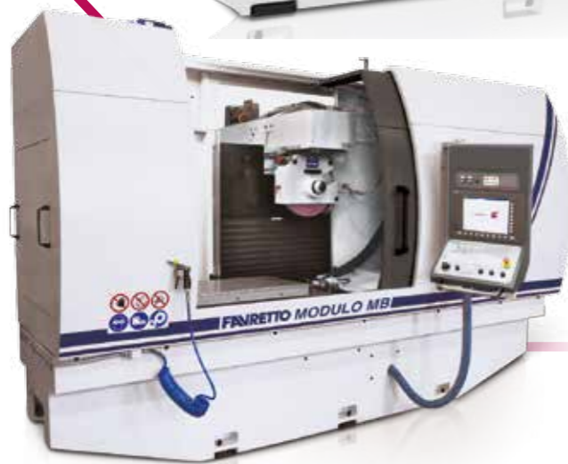
Modulo MB CNC